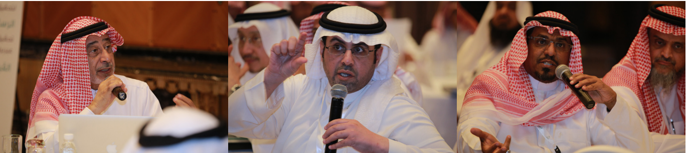
صور من مشاركة الحضور