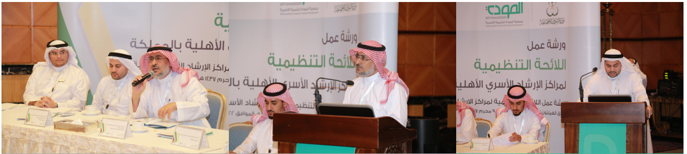
د. عبدالله السدحان وكيل الوزارة للتنمية الاجتماعية يفتح فعاليات الورشة